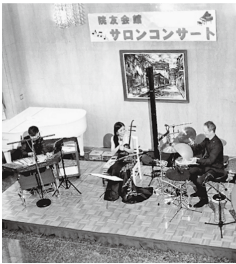
珍しい楽器のソラソラで来場者を魅了したコンサート

昨年十二月十三日(土)十四時から本年度二回目となる「院友会館サロンコンサート」が院友会館1Fロビーで開催された。今回のテーマは「二胡・揚琴・パーカッションのソラソラ」『幻想的空間への誘い』。異なる楽器が絶妙に混ざり合い、曲ごとに主張する楽器の音色、リズム感を楽しんだ。来賓者からは、好評の音が多数聞かれた。次回もお楽しみに。 ※本企画の告知は、本会HPなどで案内しております。