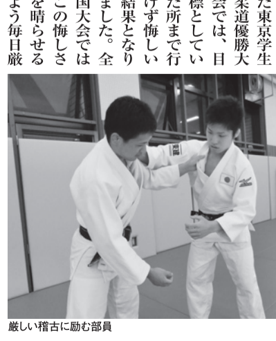
厳しい稽古に励む部員

甘んは「國炎の新風を起せ！」です。「新風」という言葉にはチーム國學院が一体となって新しい風を巻き起こし、ここから強い國學院を築き上げられる大会となりました。