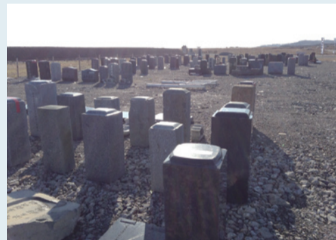
仮設地に並べられた墓石 平成27年1月11日撮影

も故郷である。同じ場所に町を再建できなくても、心象の故郷の再建は可能なのだ。墓地や神社は、その中核を成し、その土地の出身者の心を支えるに違いない。福島県南相馬市原町区下沢は全戸が流出し、鎮守である八坂神社も流された(東京の大國魂神社他の支援を受けて小社殿が新築され、平成二十四年九月に復興遷座祭が行なわれた)。この神社の横に、平成二十六年、「下沢仮設墓地」が開設され、流された墓石や墓碑、石仏墓など百七十超が並べられた。地元行政長によれば、「お盆とお彼岸に間に合うように」夏前に僧侶によって仮設地の開眼供養が行なわれた。被災地から遠く離れた人々には「お墓まで仮設か」と笑う人もいるかもしれない。だが、これが被災地の真実なのだ。 そして本年夏前にも、やはりお盆に間に合うように仮設地の近くに正式な共同墓地の整備が進められている。震災後の人口流出が多くの被災地で深刻だ。なかには先祖の墓を改葬した人がいる。その人はもうその場所へ帰らず、帰省もしないかもしれない。先祖は還る場所を喪い、今を生きる人々も、結局は、自分たちが先祖になったときに、還る場所を喪うのではないか。 東北は、五度目の夏を迎える。