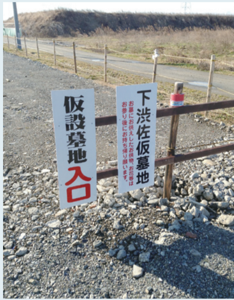
南相馬市原町区下沢の仮設墓地 平成27年1月1日撮影

だが、今次の大津波で数多くの墓地が流されてしまった。今でも墓石が転がったままの場所があれば、復旧が進んだところもある。しかし、墓地の整備は故郷の再建にとって、とても重要だ。津波被害を受け、警戒区域となった場所では町は再建できない。しかし、多くの避難民にとって、そこは今