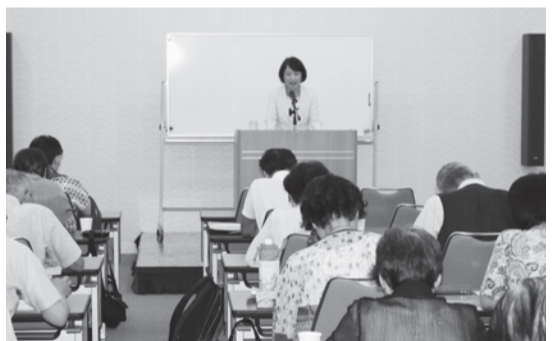
今年度開講の「万葉集への招待」