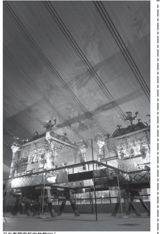
日光東照宮新宝物館ロビー