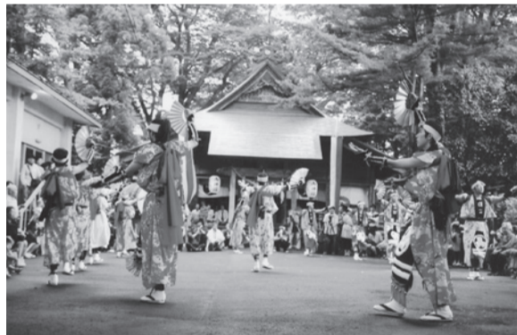
綴子神社本殿前で踊りの奉納

が、昔から水源水路の便が、悪く常に水不足に悩まされ、往時は水源地まで行って太鼓を打ち鳴らしたという話も残っている。現在は鳥居をくぐれば、程大きくなったので、隣の遊園地に上町・下町輪番制の、その年の当番が一三番太鼓まで並べて雷鳴かまがうばかりの大音を四里四方に轟かせ、合わせて露払い太夫を先頭に百名を超す大名行列の出陣である。 綴子本郷上町・下町の競い合いによって大きくなり、上町が直径三・八メートル、下町が三・七メートル(ギネス認定世界一)となり、どちらも見事に奉納する心を伝承している。 武内朋子(75文) 記