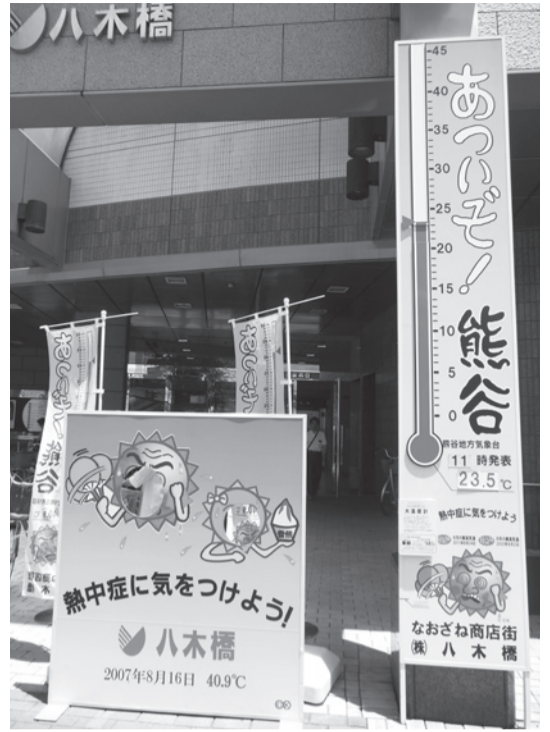
今年も全国1位になるか!!