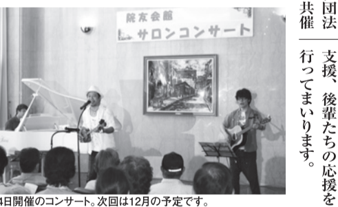
7月4日開催のコンサート。次回は12月の予定です。

【特定寄付】 東日本大震災支援関係について、引き続き國學院大學で進めている支援制度への指定寄付を二百万円、行って参ります。