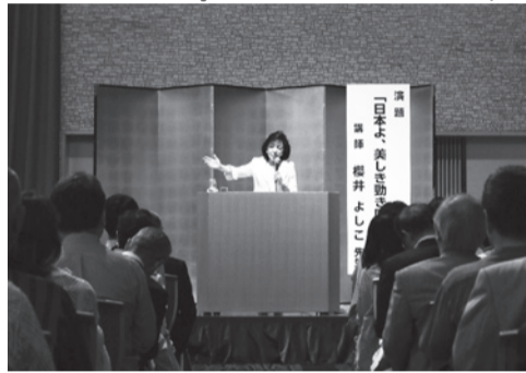
講演する櫻井よしこ先生

演会では、今年講師として、ジャーナリストでもあり国家基本問題研究所の理事長でもある、櫻井よしこ氏をお迎えした。「日本よ、美しき動き(つよき) 国となれ」というテーマで、十七時から約一時間、六百三十名余内