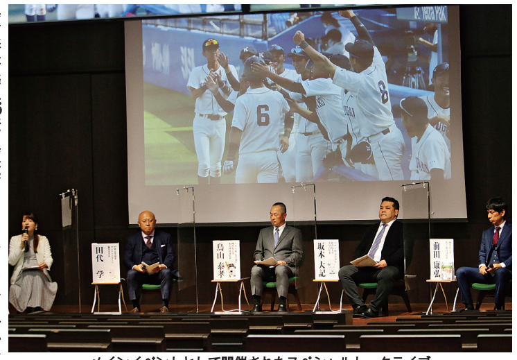
メインイベントとして開催されたスペシャルトークライブ

春先から、大学内の実施準備委員会で開催に向けて検討が始まったが、緊急事態宣言やその解除後の状況も勘案して来場型の開催は取り止め、オンラインでの開催が決定したものである。当初は、全面中止という意見もあったが、大学と院友の繋がりを大切に考える準備委員会メンバーの熱い思いが、オンライン開催での実現となった。