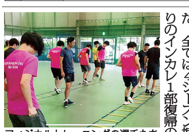
フィジカルトレーニングの選手たち

この会報がお手元に届くころには、今大会の結果が出ています。関係上、ご報告は控えさせていただきます。