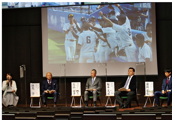
メインイベントとして開催されたスペシャルトークライブ

春先から、大学内の実施準備委員会で開催に向けて検討が始まったが、緊急事態宣言や、その解除後の状況も勘案して来場型の開催は取り止め、オンラインでの開催が決定したものである。当初は、全面中止という意見もあったが、大学と院友の繋がりを大切に考える準備委員会メンバーの熱い思いが、オンライン開催での実現となった。