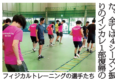
フィジカルトレーニングの選手たち

この会報がお手元に届くころには今大会の結果が出ています。関係上ご不便をおかけしますが、ご理解を賜います。