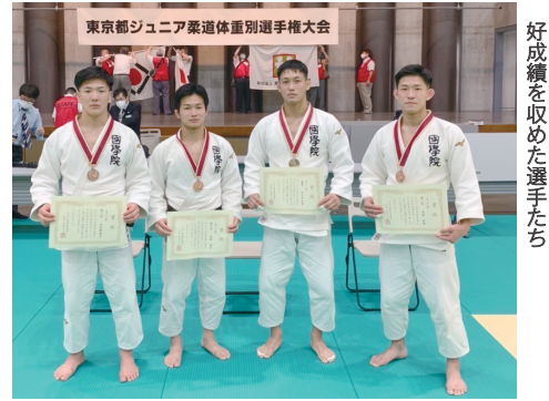
好成績を収めた選手たち

シーズンとなり、早速ジュニア世代が活躍し始めました。彼らの活躍を皮切りに今年もチャレンジ精神を忘れず、一歩一歩前進していかうと思っております。